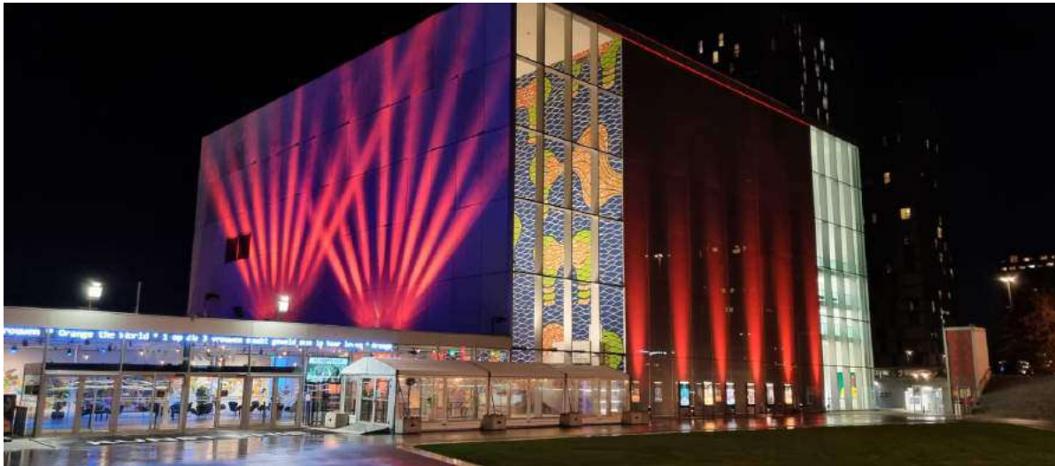
Foto: Kunstlinie in november 2021 tijdens Orange the World, met overdekte wachtruimte voor bezoekers bij controle CTB.