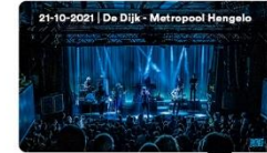
21-10-2021 | De Dijk - Metropool Hangelo

"Top! Duidelijke mail vooraf. Vriendelijke stewards En alles op t terrein netjes geregeld. Het blijft raar: een concert met weinig mensen, waarbij je niet mee mag zingen en netjes stil moet zitten. Maar de sfeer, locatie en artist maakten t juist in deze tijd wel een concert om nooit te vergeten! Succes met alles en hopelijk wordt t snel weer als vanouds!"