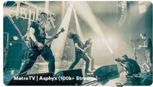
MetroTV | Asphyx (100k+ Streams)