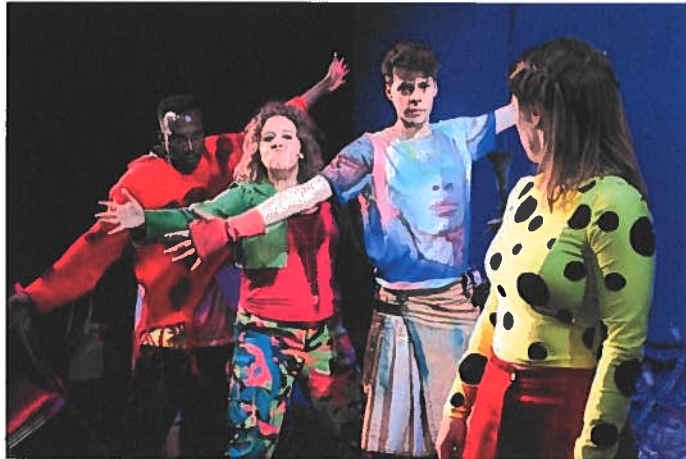
Scènefoto Metamorfosen

In deze voorstelling wordt de oude muziek van Camerata Trajectina geconfronteerd en gecombineerd met de speelstijl van Kwatta, de poëtische en bijzondere taal van schrijver Jibbe Willems en de hedendaagse muziek van componist en muzikant Laurens Beijer.