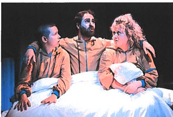
Scènefoto Blote Konten

En toen vond in juni hét theatercadeautje van 2021 plaats: de première van de productie Blote Konten , de kleinezaalvoorstelling voor 4+. Nog met een beperkte zaalcapaciteit vanwege de anderhalvemeter-regel, maar de theatersluiting en lockdown was gelukkig op tijd (voor de première in juni), opgeheven. De voorstelling werd enorm goed ontvangen. Zo werd het innovatieve karakter van Blote Konten in recensies onderstreept. Het is een voorstelling in een niet-bestaande, nieuwe, taal, waarin Kwatta in samenwerking met schrijver Jibbe Willems een belangrijke, vernieuwende stap in de ontwikkeling van het jeugdtheater na Jabber heeft voortgezet.