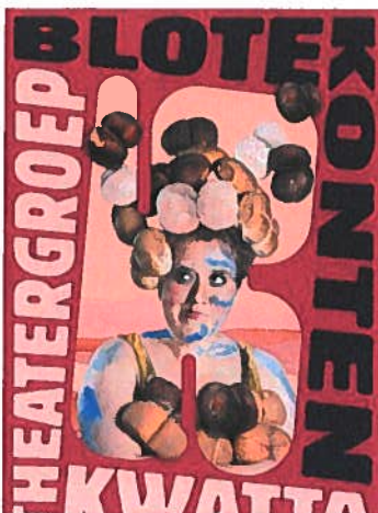
Campagnebeeld Blote Konten

Rondom elke (digitale) productie wordt een salespakket ontwikkeld om de voorstelling in de markt te zetten. Het materiaal, zowel print als digitaal, wordt landelijk ingezet door de theaters en schouwburgen die Kwatta geboekt hebben, en regionaal door Kwatta bij de vrije voorstellingen in eigen huis. Centraal voor het pakket staat het campagnebeeld, dat als basis dient voor de bijbehorende posters en flyers. Ook dient het als basis voor de digitale banners voor websites en socialmedia, en voor gevelbanners en abri-posters. Van elke productie wordt een registratie gemaakt, dat vervolgens als basis fungeert voor een voorstellingstrailer. Eerder in het traject worden ook teaserfilmpjes gemaakt, die via socialmedia en websites ingezet worden.