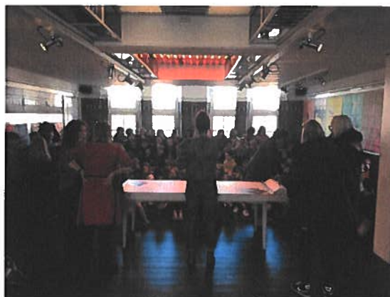
Schoolvoorstellingen in Het Badhuis

Dit betekent niet dat er geen nieuwe afnemers zijn bijgekomen in 2021; er zijn nieuwe relaties aangegaan met primair onderwijs in Velp (GLD) en omgeving, voor de afname van onze digitale programma's, en zijn relaties van afnemers uit het verleden weer nieuw leven in geblazen. Zo nam Basisschool Op Weg in Ooij (omgeving Nijmegen) na tijden weer Kwattaklassen af. Kenmerkend voor deze programmaverkopen was het 'kort-op-de-bal-spelen'. Vanwege Covid-19 kon en wilde niemand ver van te voren inkopen, dus werden de meeste afspraken in een tijdsbestek van een maand (van inkoop tot uitvoering) gemaakt.