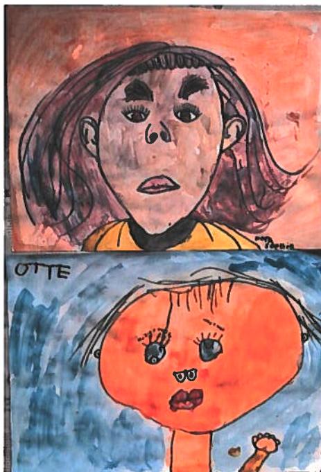
Zelfportretten door Even Niet -kijkers

Zoals in de vorige alinea aangegeven, hebben we enkele producties een digitale 'make-over' gegeven. Donderbuikjes Theater-TV en Even Niet kwamen hier uit voort. Deze programma's werden via de educatiebrochure, inclusief bijbehorende educatie en optionele workshops, aan scholen aangeboden. Dit tezamen met Zoek Luistertheater , het digitale programma dat reeds in 2020 was ontwikkeld. Het digitale aanbod besloeg hiermee alle leeftijdscategorieën van het basisonderwijs: van groep 1 tot en met groep 8. Daarnaast was Even Niet als prikkelarme theaterervaring aanvullend ook heel geschikt voor het speciaal onderwijs. Via het platform PodiumKids Thuis werden de drie programma's ook aan het vrije publiek aangeboden, en brachten we op deze wijze het theater naar de huiskamer. Ook brachten we digitaal een huiskamerbezoek met de presentatie van de educatievoorstelling Doe Het Zelf , die via werd Zoom gehouden. Zo konden de deelnemende kinderen tóch hun harde werk aan hun ouders laten zien.