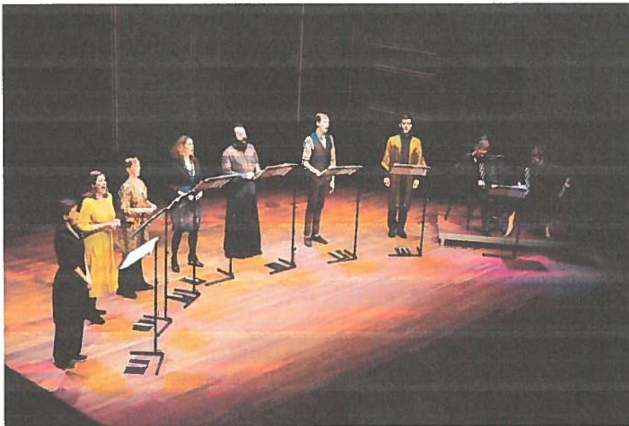
Zangers en accordeonspelers bij Psalm 151

“De toonzetting van acht alternatieve ‘psalmteksten’ nam anderhalf uur in beslag en was een lange zit. Dat lag niet aan de uitvoering door Cappella Amsterdam. De zang en voordracht (er was heel veel voordracht) waren uitstekend, met als enig minipunt dat de accenten van de buitenlandse zangers opvallend hoorbaar waren. Het lag vooral aan de teksten – waarvan het gros qua vorm niks met psalmen van doen had en enkele veel te lang waren – en de compositie.” Dagblad van het Noorden, Job van Schaik, 12-11-2018