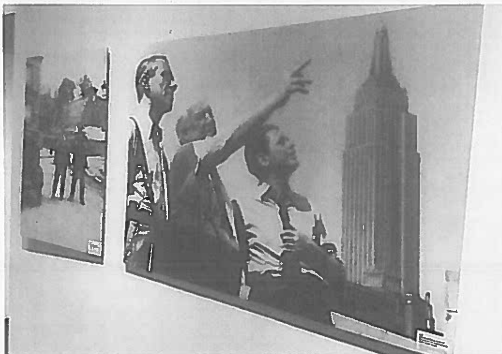
Foto: Joris Ivens expositie in LUX

Daar waar jongeren een aandachtspunt zijn in communicatie was er in 2017 een bijzonder programma waardoor ook de publiciteit voor het gesprek over 'ouder worden' met het festival UPI extra aandacht had. Hiervoor werd een grootse campagne uitgezet in Nijmegen centrum, middels 90 mupi's verspreid door de stad en via on- en offline communicatiemiddelen. Het Facebook evenement had maar liefst een bereik van 25.798 personen. Met de verbouwing van het kassagebouw en benoeming van de nieuwe filmzaal tot Joris Ivenszaal is ook een prachtige Joris Ivens expositie georganiseerd in het kassagebouw en café LUX. Deze expositie gaf het kleurrijke leven van de Nijmeegse documentarist Joris Ivens weer, alle toelichting is aangeboden middels een programmaboekje. De expo was de hele tweede helft van het jaar zichtbaar. Tevens zijn er weer een groot aantal festivals gedraaid zoals Best of the Fest, Moving futures, Vierdaagsefeesten, CineKid, Festival Jazz International Nijmegen, en IDFA en samengewerkt met partners voor Go Short en InScience.