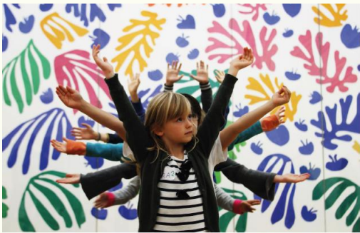
Kinderen poseren voor La petite et le arbre (1952-1953) van Henri Matisse. De kinderwerkboeken werden met steun van de Fraak en helle de Jonge Stichting gemaakt.

Nadat bestuur en personele bezetting op orde waren, is overgegaan tot de praktische zaken die het Fonds van dag tot dag zullen bezighouden. Daaronder valt onder meer het bepalen van de geefmogelijkheden, waarbij schenkers kunnen profiteren van fiscale voordelen aangezien het Fonds is aangemerkt als een Algemeen Nut Beogende Instelling (ANBI). Onder de mogelijkheden vallen bijvoorbeeld het inrichten van een Fonds op Naam of het opnemen van het Stedelijk Museum Fonds in het testament. Daarnaast kan men eenmalig of periodiek schenken met behulp van een onderhandse of notariële akte. Periodieke giften worden in principe gedaan voor een periode van vijf jaar en bestaan uit gelijke termijnen van €5.000 of €15.000. Het staat de gever uiteraard vrij om van deze geefniveaus af te wijken en de bijdrage naar eigen inzicht aan te passen.