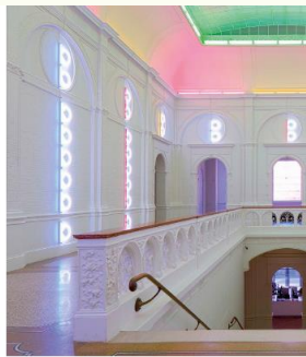
Dan Flavin, untitled (to Piet Mondrian) © Dan Flavin, c/o Pictoright Amsterdam