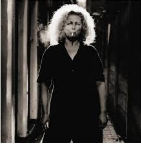
Anton Corbijn, Marlene Dumas , 2000, chromogene kleurendruk