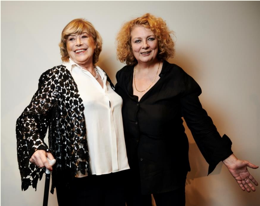
Marianne Faithfull en Marlene Dumas bij de lancering van het Stedelijk Museum Fonds

Naast deze prachtige schenking aan het museum was van het werk ook een piëzografie vervaardigd in een oplage van honderd. Als dank voor hun steun bood het museum de nieuwe begunstigers van het Fonds een exemplaar van dit werk aan. Voor hen die tijdens de lancering als Fellow instapten, was niet alleen een persoonlijke opdracht op de piëzografie van Marlene mogelijk, maar ook het laten signeren ervan door Marianne Faithfull.